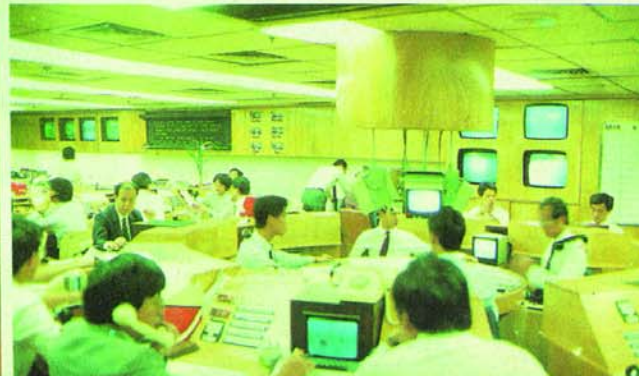
◀新鴻基證券交易所。